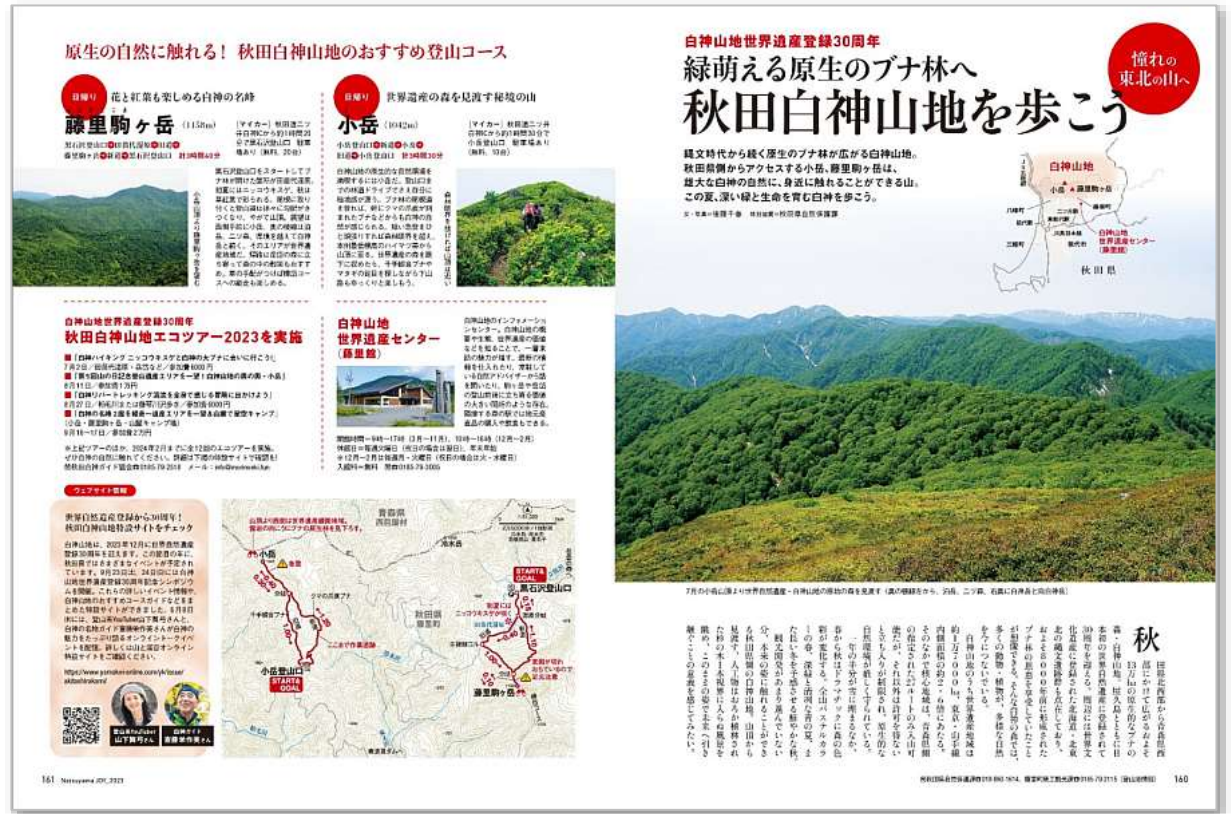
秋田県自然保護課様